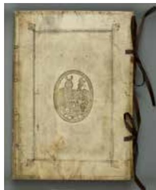
3 | Supralibros: Wappen der Fugger von Kirchberg und zu Weißenhorn, Fürmalung und künstliche Beschreibung der Horologien, Petri, Basel 1544

Im Idealfall gibt schon der Einband selbst einen Anhaltspunkt auf den ehemaligen Besitzer, indem sein Wappen oder sogar sein Name eingeprägt ist. Diese Kennzeichen nennen sich »Supralibros«, weil sie sich auf den Büchern befinden. Ein solches ist im Fall des Einbandes eines Werkes zu Sonnenuhren aus dem Jahr 1544 in Gestalt eines Wappens zu finden und gibt Auskunft über den Besitzer aus dem Hause Fugger von Kirchberg und zu Weißenhorn. Das Dekor des Pergamenteinbandes lässt auf eine spätere oder erneute Bindung Anfang des 17. Jahrhunderts schließen (Abb. 3).