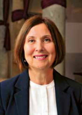
1 | Foto und: © Thomas Schmidt