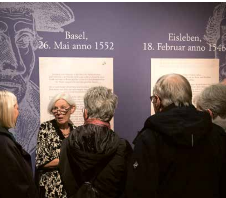
2 | Blick in die Ausstellung: Doppelporträts