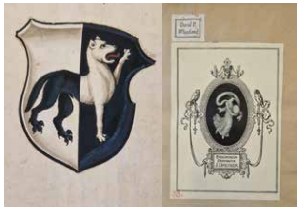
4 | Wappen der Familie Lupin, Hebraica Biblia , Petri und Isengrin, Basel 1534

Exlibris aus dem 19./20. Jahrhundert sind beispielsweise in der Abhandlung über Sonnenuhren ( Composito Horologiorum ) von 1531 zu finden. Eines stammt aus der Bibliothek von Eugen Graf von Silva-Tarouca aus dem Jahr 1878. Ein weiteres mit Jugendstilmotiv gibt den bedeutenden Sonnenuhrensammler Joseph Drecker (1853–1931) als Besitzer preis (Abb. 5). Der marmorierte Einband stammt aus dem 19. Jahrhundert. Wie das jüngste Exlibris in diesem Werk verrät, war der nächste