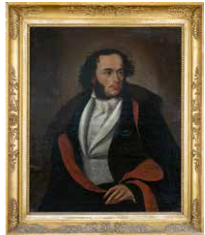
1 | Ölgemälde: Martin Mohr, ca. 1820 bis 1830, ohne Rahmen: 74 x 90 cm.

Engagement für gesellschaftlichen Zusammenhalt und kulturelle Entwicklung.