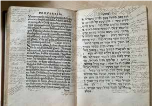
6 | Seite aus Proverbia Salomonis, Froben, Basel 1524

Rückschlüsse auf den Besitzer gezogen werden. Im Fall von Sebastian Münster sind diese häufig in Zusammenhang damit zu sehen, dass seine gesamten Werke von der katholischen Kirche ab 1559 auf dem Index der verbotenen Bücher standen und deshalb sein Name durchgestrichen wurde. Das finden wir in dem Buch »Rudimenta Mathematica« von 1551 und in der italienischen Kosmographie von 1575, die ohnehin bereits von der katholischen Zensur bereinigt war (Abb. 7).