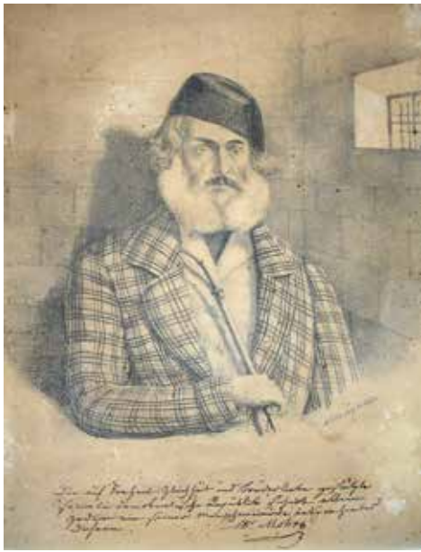
2 | Die Lithographie zeigt Martin Mohr in Kerkerhaft im Eisenturm zu Mainz, 1849/50. Signatur am rechten Bildrand: »N. d. Nat. gez. Ed. Müller.« Handschriftlicher Vermerk Martin Mohrs unter dem Porträt: »Nur die Staatsverfassung, deren Grundlagen Freiheit, Gleichheit und Brüderlichkeit sind, kann das Wohl aller Staatsangehörigen auf die Dauer sichern.«

noch ein wertvolles Dokument für die regionale Kunstgeschichte. Das Bild zeigt eine realistische Darstellung Mohrs, ohne übertriebene Idealisierung, was den authentischen Eindruck seines Erscheinungsbildes unterstreicht. Die Haltung und Mimik vermitteln Selbstbewusstsein, Würde und die Überzeugungskraft eines engagierten Bürgers.