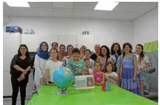
2 | »Die Prinzessin und ich« in Kooperation mit dem Migrations- und Integrationsbüro und der Interkulturellen Frauengruppe des Mehrgenerationenhauses, 7. August 2024

Parallel boten wir den begleitenden Kindern ein spannendes Museumsprogramm. Im Rahmen praktischer Workshops und beim Büfett mit selbst produzierten Snacks kam die Gruppe abschließend miteinander ins wertschätzende Gespräch.