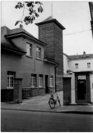
2 | Das Spritzenhaus mit Schlauchturm

einer ungesunden Entwurzelung der Bevölkerung empfunden. Dem bot die Heimatschutzarchitektur, die eine schlichte moderne Formensprache mit traditionellen und ländlichen Merkmalen kombinierte, einen Gegenentwurf. Konkret bedeutete dies eine Orientierung an gewachsenen ortstypischen Erscheinungsbildern, zum Beispiel in Dach- und Fensterformen, dem Grundriss oder auch der Fassadengestaltung, möglichst unter Verwendung regionaler Baumaterialien. Historische Bezüge durften durchaus in die Architektur einfließen, dann aber maßvoll und in Anlehnung an die Lokalgeschichte. Es ist an dieser Stelle wichtig zu betonen, dass die Heimatschutzarchitektur für die nationalsozialistische Ideologie durch den Heimatbezug stark anknüpfungsfähig war, sie aber vom Grundgedanken keine faschistische oder gar »nationalsozialistische Architektur« ist. Den Konzepten der Heimatschutzarchitektur folgte auch die Gestaltung des neuen