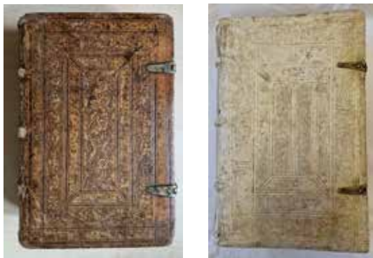
2 | Bucheinbände von links nach rechts: Dictionarium Hebraicum, Froben, Basel 1525, Opus Grammaticum, Petri, Basel 1549

Wohlhabendere Besitzer wählten einen Lederbezug auf Holz, der nach der damaligen Mode im deutschsprachigen Gebiet mit blindgedruckten Motiven verziert war, wofür es zahlreiche Beispiele aus dem Museumsfundus gibt (zwei deutsche Kosmographien, Wörterbücher, aber auch religiöse Werke wie die Hebräische Bibel oder das Matthäusevangelium) (Abb. 2).