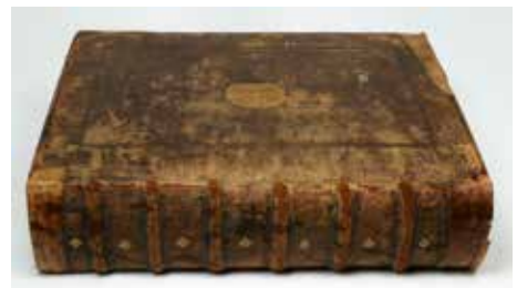
1 | Lateinische Kosmographie von Sebastian Münster, gedruckt 1559 bei Petri in Basel

Das Buch, das verkürzt den lateinischen Titel COSMOGRAPHIAE UNIVERSALIS LIBRI VI. trägt, stammt wie auch die anderen originalen Kosmographien aus der Druckerei von Heinrich Petri (1508–1579), dem Stiefsohn von Sebastian Münster. Es umfasst 1.162 Seiten inklusive 14 Karten, 37 doppelseitige Stadtansichten und ca. 970 Holzschnitte im Text. Eingeschlagen ist es in einen Kalbsledereinband auf sechs erhabenen Doppelbünden mit Golddruck. Die Buchdeckel weisen ebenfalls in Gold ein ovales Mittelornament und Eckfleuronen auf (Abb. 1).