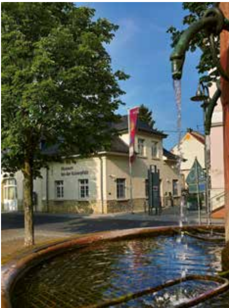
1 | Blick aufs Museum bei der Kaiserpfalz, im Vordergrund der Fließbrunnen von 1811 auf dem François-Lachenal-Platz

2024 feierte unser Museum bei der Kaiserpfalz sein 25-jähriges Jubiläum am Standort François-Lachenal-Platz 5. Am 7. Mai 1999 zog das Stadtmuseum nach einer langen Odyssee mit einem Teil seiner Sammlung ins ehemalige Nieder-Ingelheimer Spritzenhaus von 1934 ein. Fünf Jahre später wurde es durch einen modernen Glasanbau erweitert.