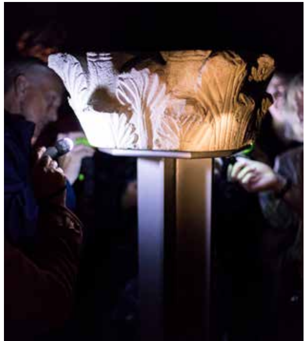
4 | Suche nach Farbspuren

Auf Grundschulkindern zielen die anderen beiden Führungsformate. Unter dem Titel »Alles dunkel? – Alles bunt?« erforscht die Gruppe im Schein der Taschenlampe römische Objekthighlights und nimmt dabei insbesondere Farbspuren in den Blick: So wird die elegante, einst mehrfarbige Kleidung der Römerin »Prima« untersucht, über die Blaufärbung römischer Glasgefäße gegrübelt und die Funktion und Bedeutung der »antiken Taschenlampe« verstanden. Bei der dritten Taschenlampenführung unter dem Titel »Schatzsuche im Dunkeln« lösen die kleinen und großen Teilnehmer*innen Rätsel mithilfe einer alten Karte und entdecken dabei Objekte aus Steinzeit, Antike und Mittelalter, die Ingelheimer Archäolog*innen ans Licht gebracht haben. Das historische Abenteuer kann schließlich nur mit Hilfe der Taschenlampen gelöst werden.