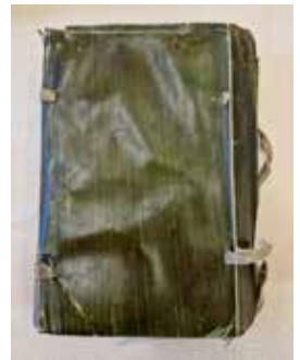
1 | Bucheinband Dictionarium Chaldaicum, Froben, Basel 1527, Bucheinband Opus Grammaticum, Petri, Basel 1556