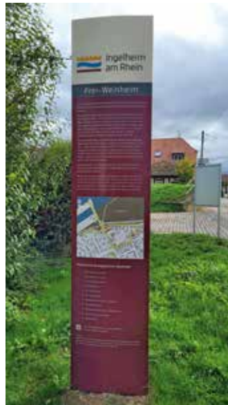
3 | Einführungsstele in Frei-Weinheim

Als nächstes wird der historische Rundgang im Stadtteil Großwinternheim neu gestaltet, sodass man auch dort bald die interessante Ortsgeschichte bei einer überarbeiteten Tour erleben darf, die einige neue Stationen beinhalten wird. Ortsbildprägend sind die ehemaligen adligen Höfe. Es kann schon verraten werden, dass die Besucher*innen auf den Tafeln als wiederkehrendes Symbol ein stilisierter Adelshof begleitet wird.