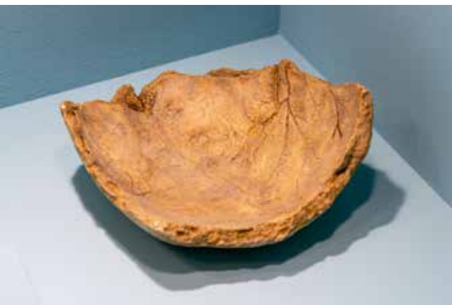
1 | Sogenannte »Schädelkalotte eines Neandertalers« aus Ochtendung (Lkr. Mayen-Koblenz)

Beispielhaft sei die Thematik anhand der bekannten Schädelkalotte aus Ochtendung erläutert (Abb. 1): Das Objekt sorgte 2024 landesweit für Aufsehen, als mittels C14-Methode der Nachweis erbracht werden konnte, dass der Fund aus dem 7./8. Jh. n. Chr. stammt. Laut dem ehemaligen Landesarchäologen Axel von Berg handelte es sich